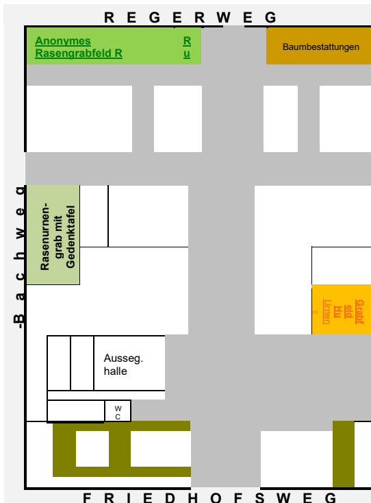
Skizze alter Teil und 1. Erweiterungsteil