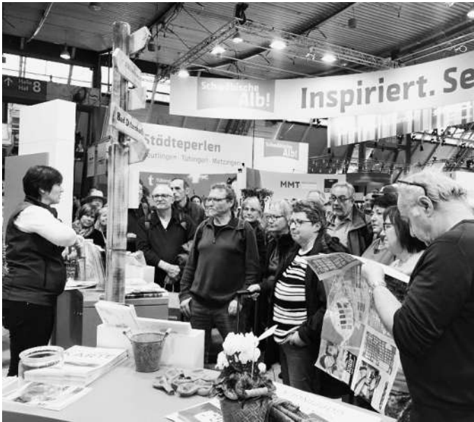
Verlosung von Dr. Hauschka Kosmetikartikeln